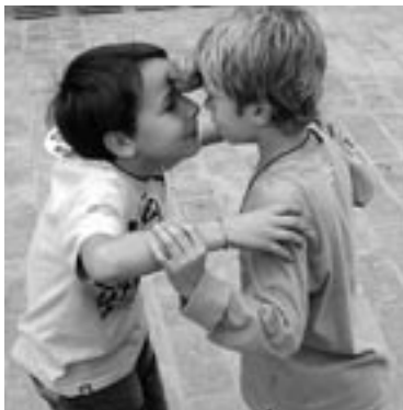
Cicle Mitjà. Prova del moniato