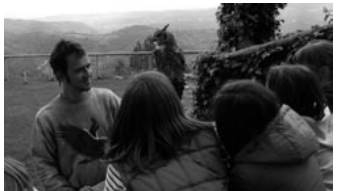
5è de primària al Cim d'Àligues