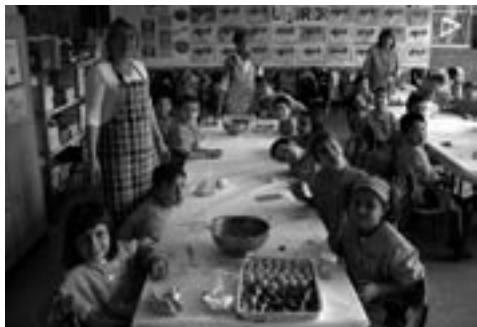
Alumnes de Cicle Inicial fent panellets. Agraïm la col·laboració de les mares, àvies, tietes, cangurs...