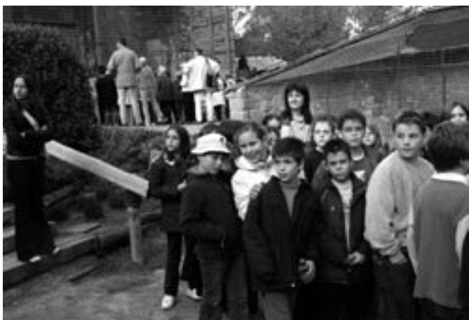
5è de primària al Cim d'Àligues