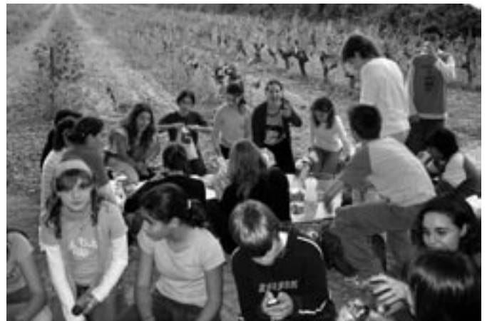
Alumnes de 1r Cicle d'ESO

El dia plujós no va acompanyar gens la festa. 1r i 2n conjuntament van anar al llac de Can Codorníu a berenar coques, pastissos, fruits secs i altres productes típics de la tardor però només arribar-hi va començar a ploure, de manera que es varen haver d'eixoplugar sota els arbres o amb bosses de plàstic al cap. Una festa mullada però diferent i divertida.