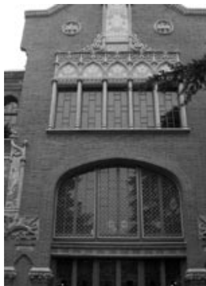
1r de Batxillerat a Reus. Institut Pere Mata