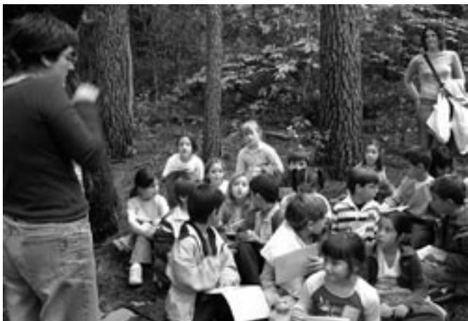
2n de primària al Montseny