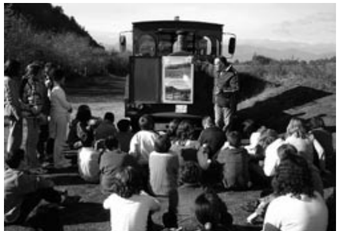
1r d'ESO a Olot