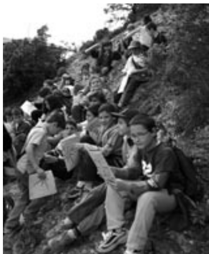
3r de primària a Montserrat