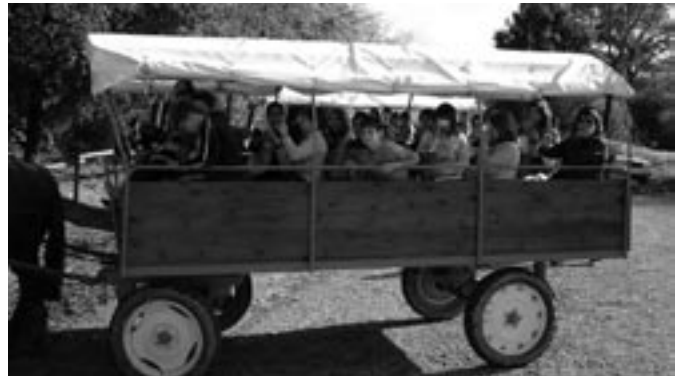
1r d'ESO a Olot