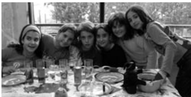
Alumnes de Cicle Superior