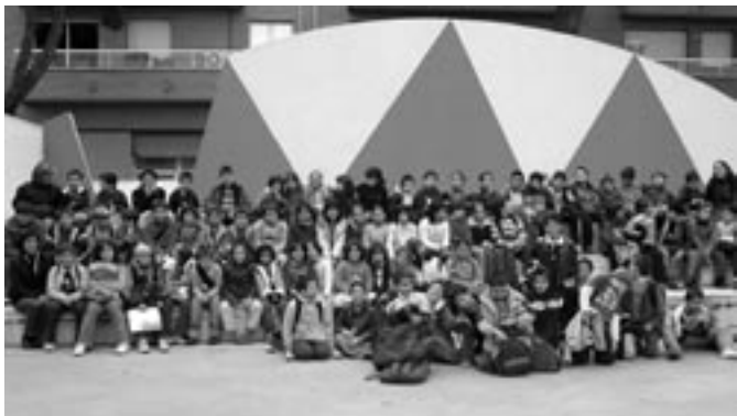
4t de primària a Vilafranca