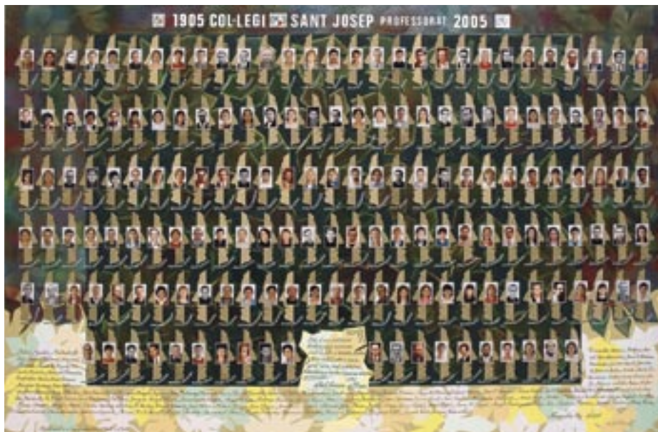
Orla del professorat d'un segle de docència al Col·legi Sant Josep 1905-2005. Aquesta orla ha estat obsequiada per la Fundació del col·legi a cadascun dels professors actuals, amb motiu del centenari.