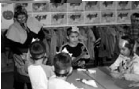
Cicle Inicial. Castanyera repartint llibres