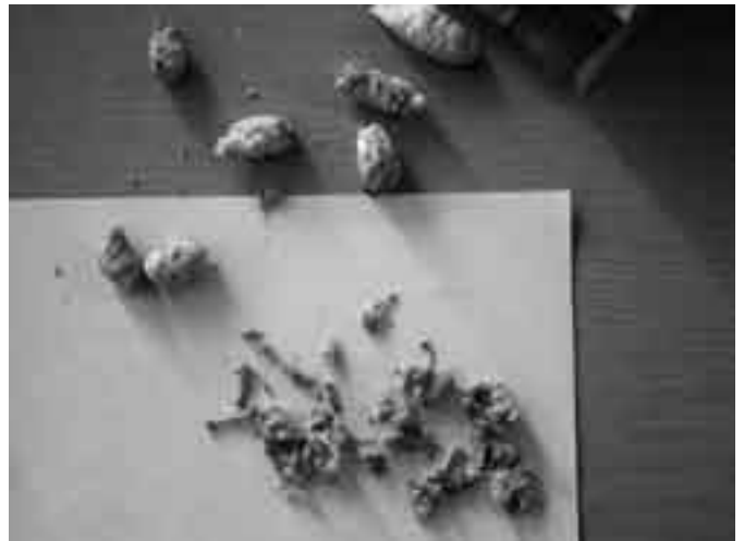
Excrements d'àguila · 5è de primària al "Cim de les àguiles"

El dia 29 d'octubre els alumnes de 1r de Batxillerat varen estar a Girona. Primerament varen veure el Call de la Ciutat, després van estar al Centre Bonastruc Ça Porta (museu jueu) i finalment els Banys àrabs de la Ciutat Medieval.