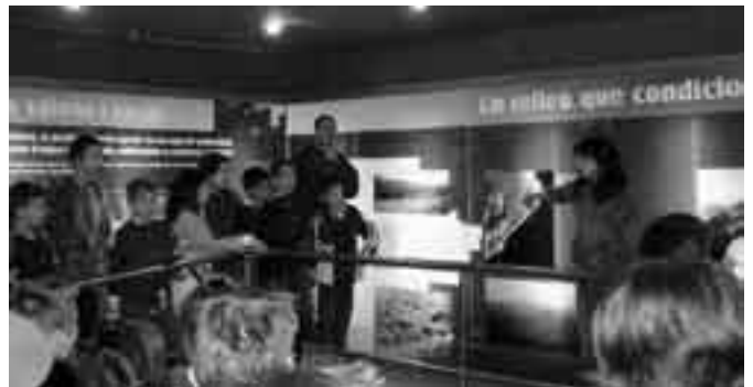
1r d'ESO al Parc de Collserola