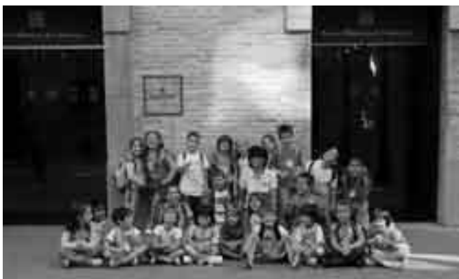
P5 al Museu d'Història de Catalunya