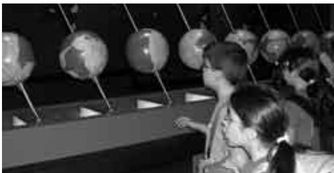
4t de primària al Cosmocaixa