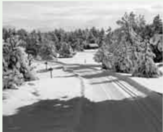
Guils - Fontanera

Els monitors de la sortida són els mateixos que porten la casa de colònies d'Oliola (Pons), on aniran aquest final de curs els alumnes de 2n d'ESO per fer esports d'aventura.