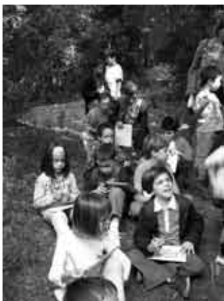
2n de primària al Montseny