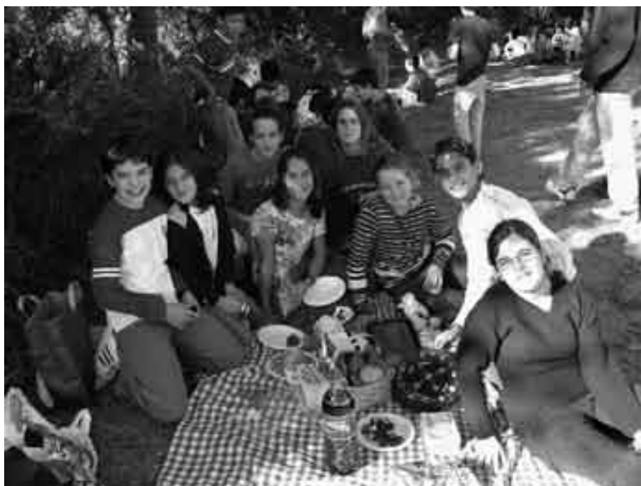
1r Cicle d'ESO