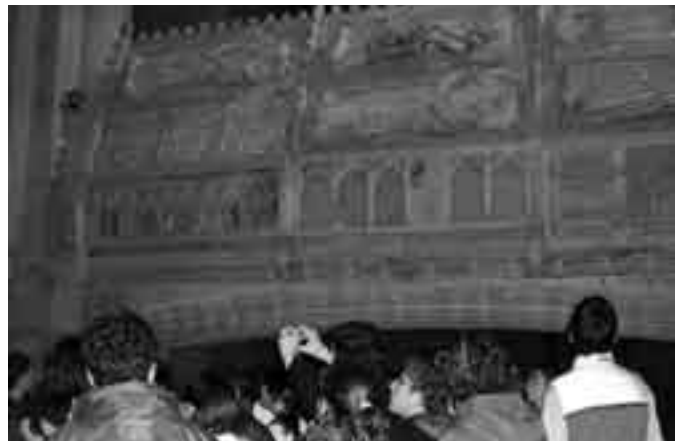
2n d'ESO al monestir de Poblet