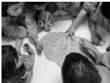
P5 al taller de galetes de tardor