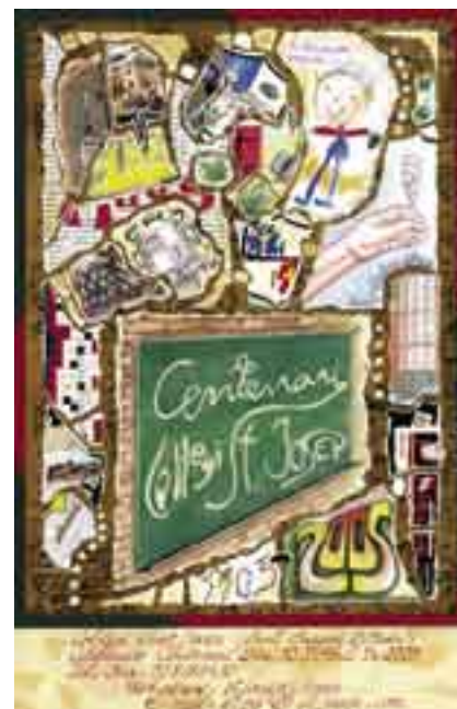
Cartell del centenari del col·legi