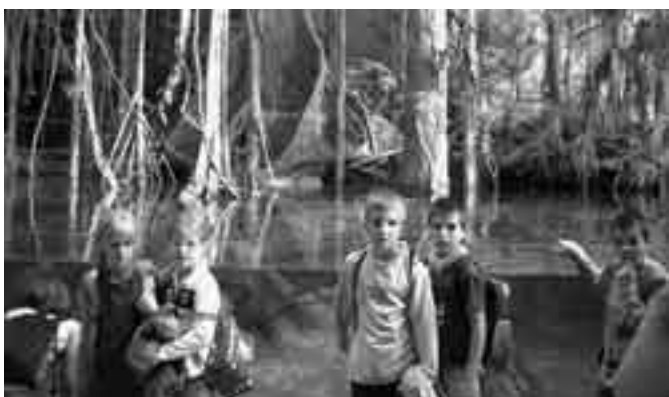
4t de primària al Cosmocaixa