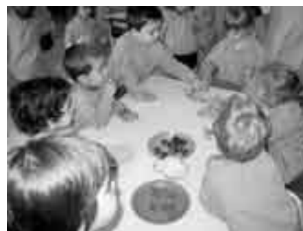
Fent un taller d'aliments

Els més grans van celebrar la Castanyada la tarda del 29 al llac de can Codorníu. Cada classe va organitzar-se en grups per preparar un bon berenar col·lectiu amb productes típics d'aquesta època de l'any.