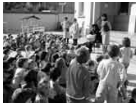
Al pati amb la Castanyera