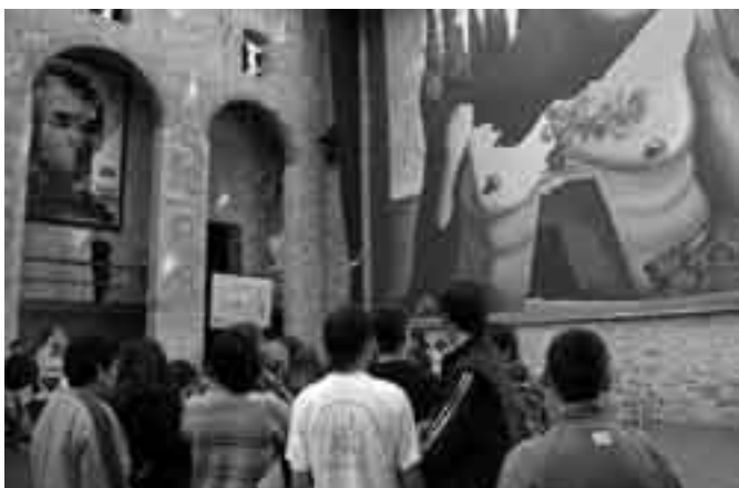
4t d'ESO al Museu Dalí