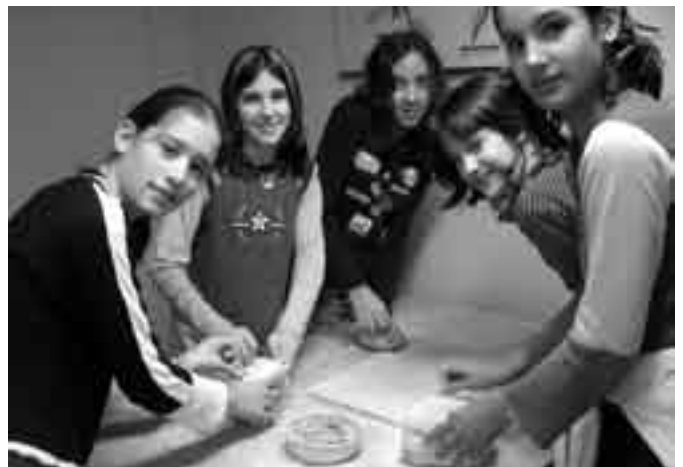
6è de primària a Gavà