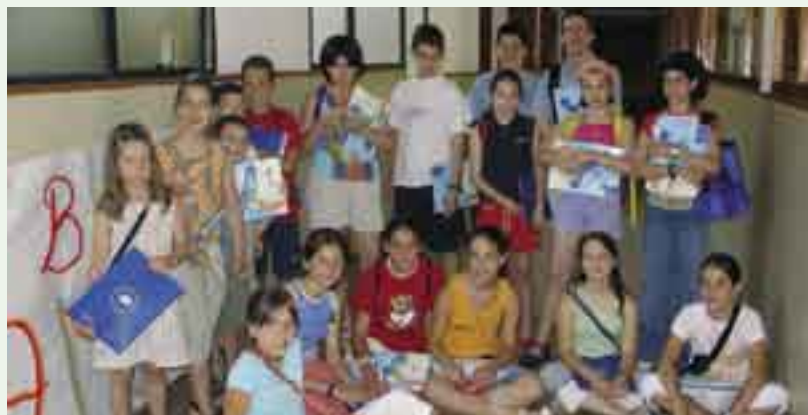
El primer dia