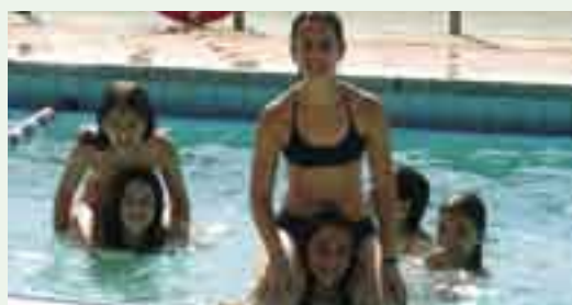
També anàvem a la piscina