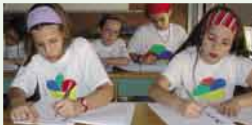
Tots portàvem la samarreta que nosaltres mateixos vam pintar