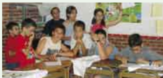
De tant en tant, fem gimcanes