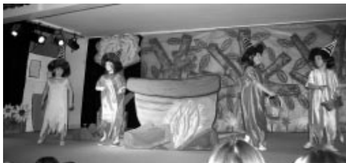
"La rondalla de l'àvia"

Totes les obres van ser representades a la Sala d'Actes de l'escola.