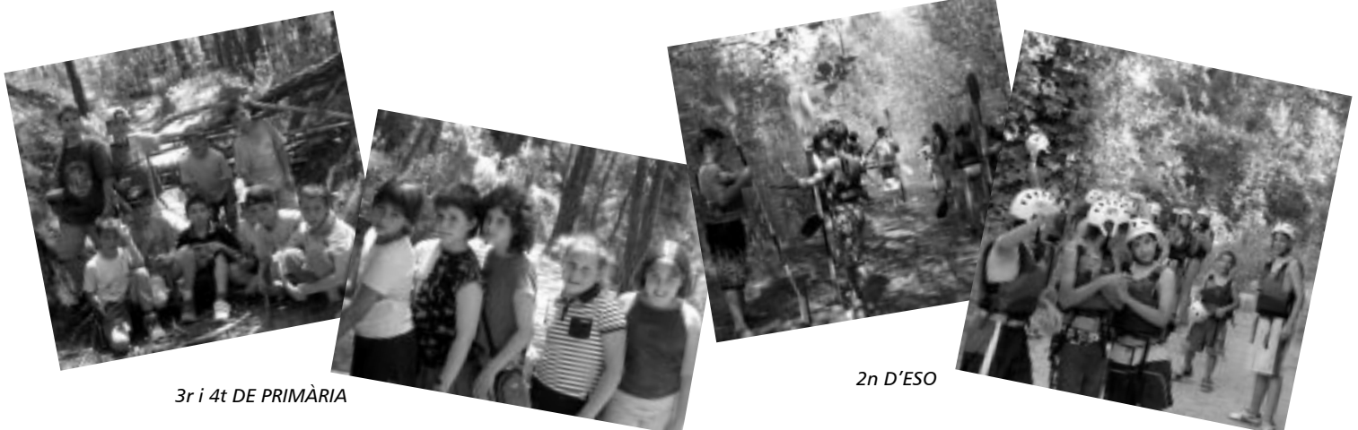
3r i 4t DE PRIMÀRIA