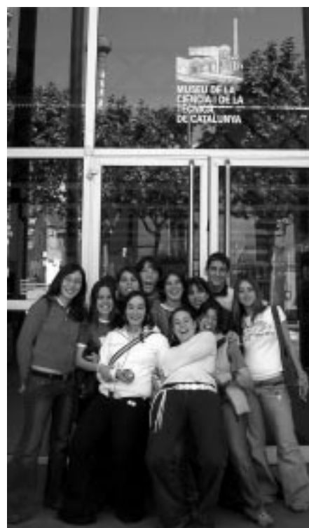
1r de Batxillerat a Terrassa