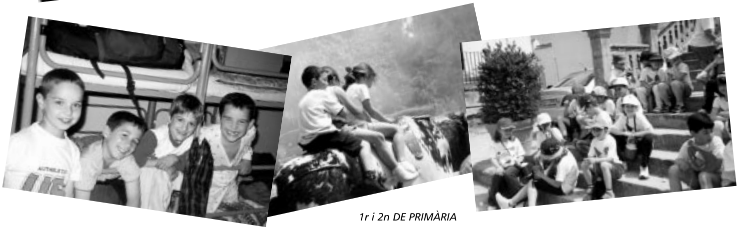
1r i 2n DE PRIMÀRIA