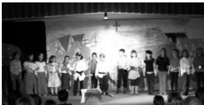
"L'espasa del Rei Artús"