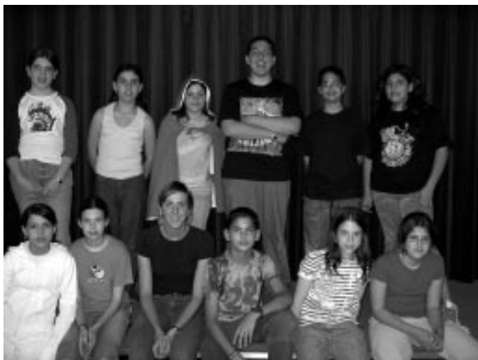
"T'he enxampat Caputxeta"