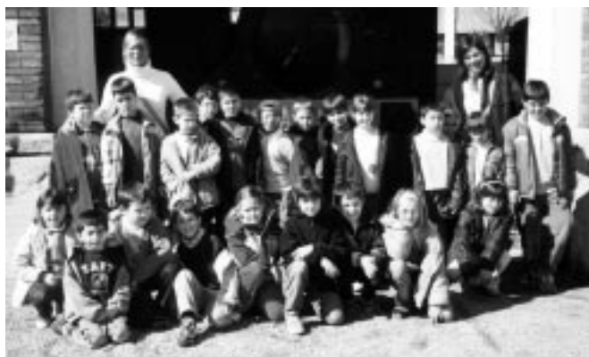
2n de primària a Vilanova