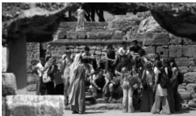
3r d'ESO a Empúries