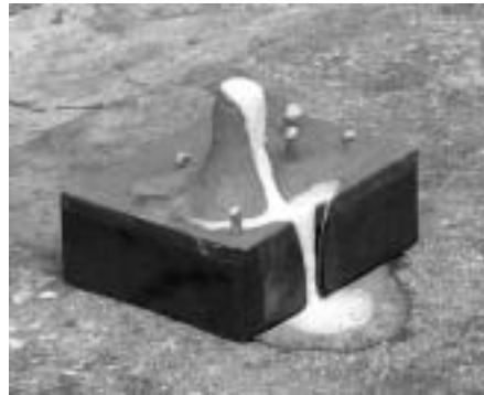
2n EP C Els volcans