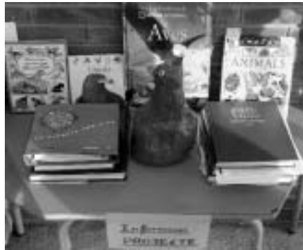
2n EP B L'Àguila