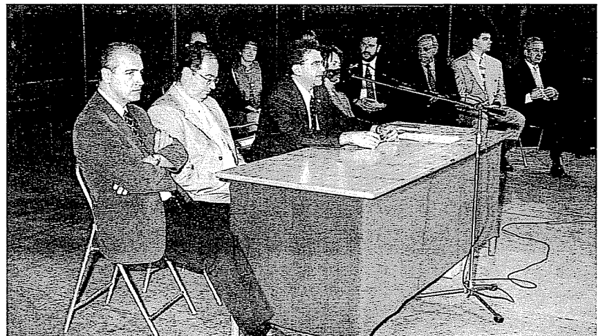
Festa de comiat de 2n de batxillerat