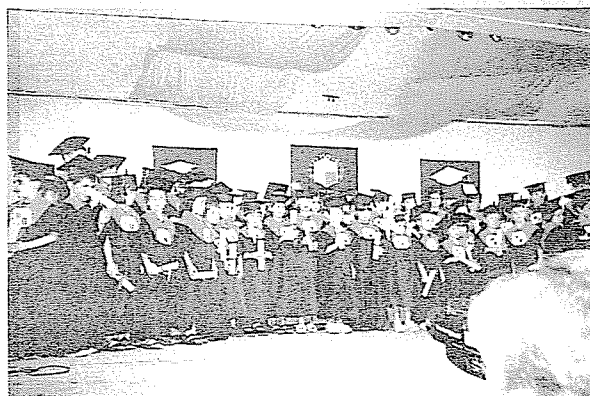
Festa de graduació infantil

Els alumnes d'educació infantil també van ser acomiadats amb una Festa de graduació el dia 18 de juny a les 6 de la tarda. La celebració va tenir lloc a la Sala d'Actes del Col·legi amb la col·laboració de les tutores. Els nens anaven vestits de negre i portaven un birret. En acabar, van cantar una cançó escrita per les professores. Nens, pares i professors van acomiar-se molt il·lusionats fins al curs vinent.